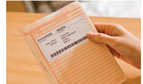
Potilaskortiston ja muiden tärkeiden tietojen haku on nopeaa tunnistetarran avulla