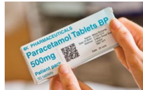
Tarraan voidaan lisätä suuri määrä nopeasti luettavaa tietoa 2D-viivakoodin avulla