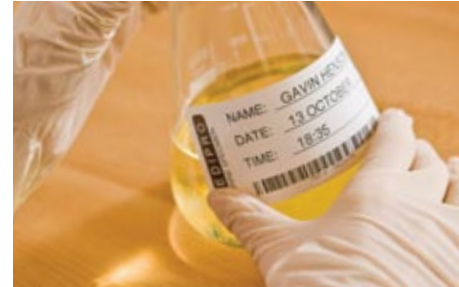
Varmistaa, että potilasnäytteet on merkitty selkeästi ja luotettavasti