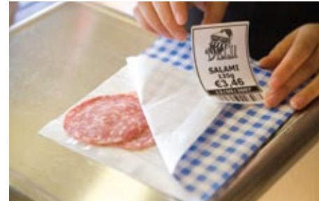
Varmista, että asiakkaat saavat kaikki haluamansa tuote- ja ainesosatiedot