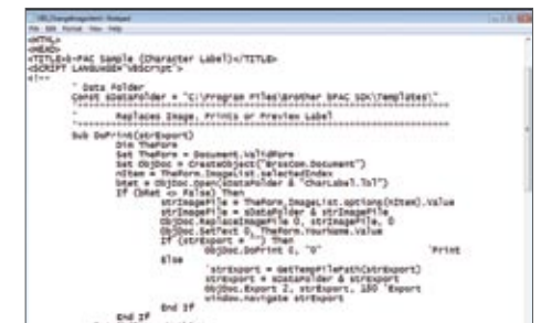
b-PAC SDK:n avulla tarratulostuksen voi lisätä suoraan Windows™ -sovelluksiin