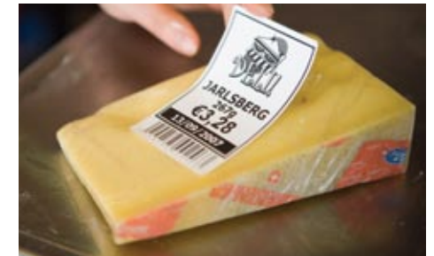
Brotherin RD-rullissa käytetty sertifioitu liima on turvallinen elintarviketeollisuuden tarroihin