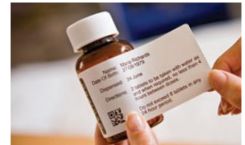
Saatavana erikokoisia tarroja yleisimmin käytettyihin tarrasovelluksiin