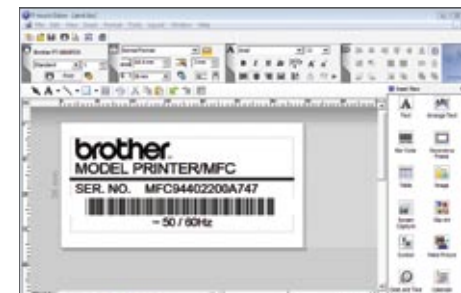
P-touch Editor 5 sisältää kaiken tarvittavan kaikenlaisten tarrojen suunnitteluun ja tulostukseen

Suunnittele tarrat tietokoneella ja lataa ne tulostimen muistiin malleiksi. Tämän jälkeen tarvitsee vain lähettää tarraan lisättävä teksti tai viivakoodi, jolloin laite yhdistää tiedot aikaisempaan malliin ja tulostaa uuden tarran. Tarroja voi tulostaa myös ilman tietokoneyhteyttä esimerkiksi yhdistämällä laitteen suoraan viivakoodiskanneriin ja tulostamalla kopioita viivakoodeista.