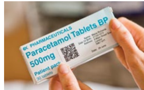
Tarraan voidaan lisätä suuri määrä nopeasti luettavaa tietoa 2D-viivakoodin avulla