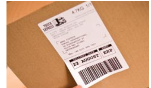
Viivakoodit, yritysten logot ja muut tiedot on helppo tulostaa jopa 102 mm:n levyisinä