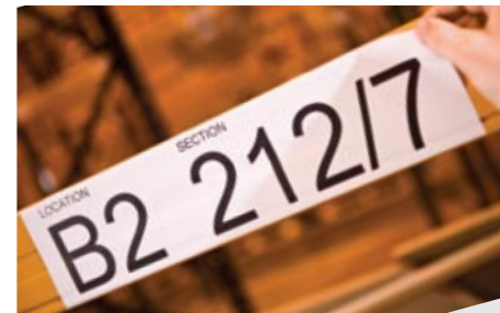
Tilapäisiä varastossa tarvittavia tunnistetarroja voidaan luoda tarvittaessa.