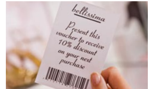
Tarjoo asiakkaille kanta-asiakasalennuksia tai muita etuja tulostettavien kuponkien avulla