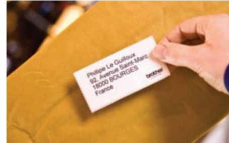
Osoitetarrojen luominen on helppoa ja nopeaa, voit lisätä tarroihin myös logoja ja muita kuvia

TD-4000- ja TD-4100N-malleihin sopivat yleisimmät lähetetarrakoot. Lisäksi niillä voidaan luoda juuri halutun kokoisia tarroja automaattisen tarraleikkurin avulla, joten ne soveltuvat erinomaisesti varastoissa tarvittavaan merkintään. Brotherin RD-tarrarullat on valmistettu korkealaatuisista materiaaleista, joten tekstit ja viivakoodit säilyvät luettavina tuotteiden kuljetuksen ajan.