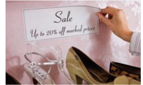
Tarjoushintojen merkintä on helppoa ja nopeaa jatkuvan rullatarran avulla