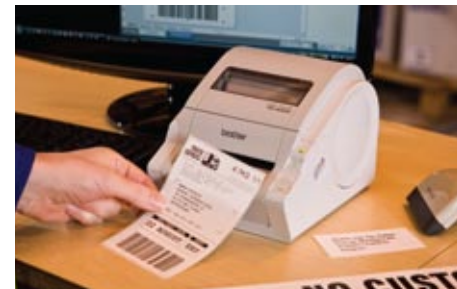
TD-4000- ja TD-4100N-mallit soveltuvat monenlaisten tarrojen tulostukseen

TD-4000 ja TD-4100N käyttävät Brotherin RD-tarroja. Laadukkaan lopputuloksen varmistavia, tahriintumista ja kulumista kestäviä tarroja on saatavana erikokoisina sekä valmiiksi muotoon leikattuina että rullina. Useimpien tavanomaisten tarrakirjoittimien käyttämien valmiiksi leikattujen tarrarullien lisäksi voidaan käyttää yhtenäisiä rullatarroja, joista voidaan leikata automaattisen tarraleikkurin avulla jopa kolmen metrin mittaisia tarroja ja opasteita.