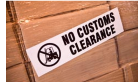
Yhtenäisen rullatarran avulla voidaan luoda tilapäisiä opasteita tarvittaessa