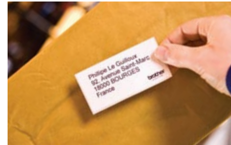
Osoitetarrojen luominen on helppoa ja nopeaa, voit lisätä tarroihin myös logoja ja muita kuvia

TD-4000- ja TD-4100N-malleihin sopivat yleisimmät lähetetarrakoot. Lisäksi niillä voidaan luoda juuri halutun kokoisia tarroja automaattisen tarraleikkurin avulla, joten ne soveltuvat erinomaisesti varastoissa tarvittavaan merkintään. Brotherin RD-tarrarullat on valmistettu korkealaatuisista materiaaleista, joten tekstit ja viivakoodit säilyvät luettavina tuotteiden kuljetuksen ajan.