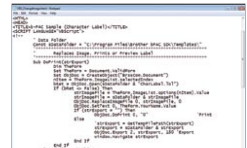
b-PAC SDK:n avulla tarratulostuksen voi lisätä suoraan Windows™ -sovelluksiin