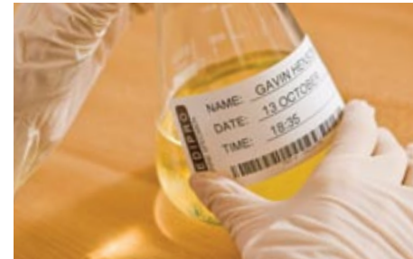
Varmistaa, että potilasnäytteet on merkitty selkeästi ja luotettavasti