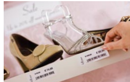
Luo tai vaihda hyllymerkinnät helposti ja nopeasti saatavuustilanteen mukaan