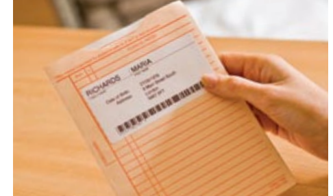
Potilaskortiston ja muiden tärkeiden tietojen haku on nopeaa tunnistetarran avulla