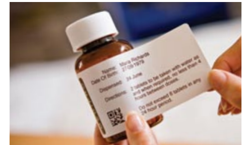
Saatavana erikokoisia tarroja yleisimmin käytettyihin tarrasovelluksiin