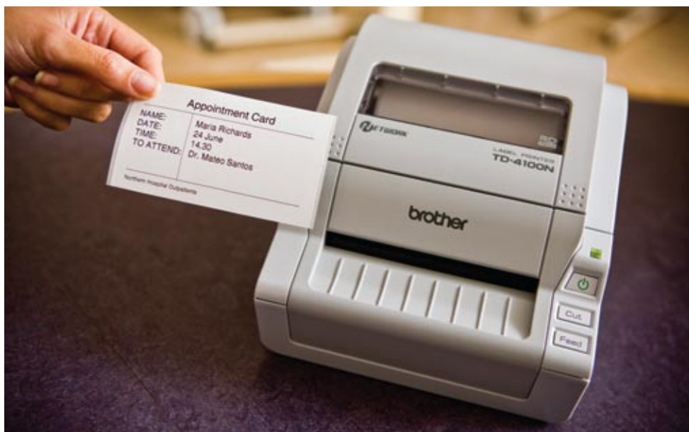
Kytkemällä TD-4100N verkkoliitäntään se voidaan sijoittaa sinne, missä tarroja tarvitaan