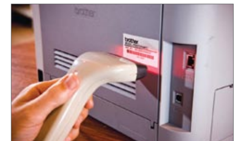
Kytkemällä viivakoodiskanneri tulostimen sarjaporttiin tarroja voi tulostaa suoraan TD-4000/TD-4100N:stä*