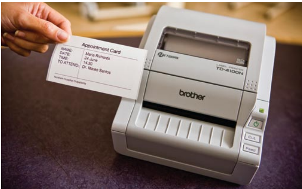
Kytkemällä TD-4100N verkkoliitäntään se voidaan sijoittaa sinne, missä tarroja tarvitaan